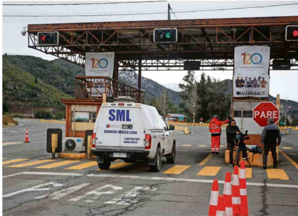
CODELCO INFORMÓ QUE SE ENTREGARON ESTOS ANTECEDENTES AL MINISTERIO PÚBLICO.

"El Informe de Consultoría Internacional", a partir de la tragedia de 2025, identificó debili-