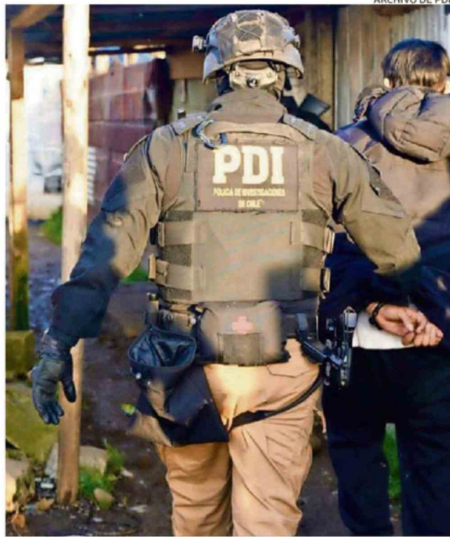
33 DE LOS DETENIDOS FUERON EN VALDIVIA. EL RESTO FUE EN EL RANCO.

Al respecto, informó que “este es el resultado de un tra-