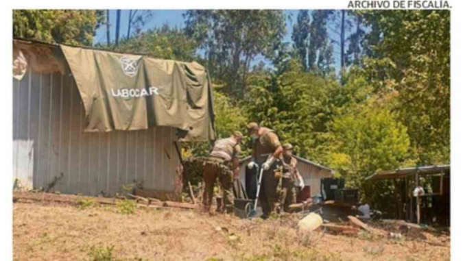
LAS DILIGENCIAS SON REALIZADAS POR CARABINEROS DE LA SEBV.

Desde que realizan diligencias en el sitio de Chuñil, hace unas semanas se encontraron manchas de sangre que correspondían a humanos. Las muestras fueron derivadas a Santiago para identificar si es