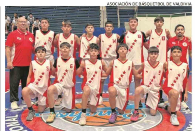
ANOCHÉ VALDIVIA ENFRENTABA A VALPARAÍSO EN EL CIERRE DEL GRUPO A.

Y destacó que "lo hemos dicho, queremos resaltar nuestra naturaleza, los espacios urbanos, poniéndolos en valor, y además generando actividades interesantes y también inspiradoras para nuestra gente, para los valdivianos y valdivianas, así que invitarlos porque hay actividades gratuitas, ustedes llegan acá nomás, disfrutan del parque, va a haber música con La Rata Bluesera el domingo. Entonces, además es un evento familiar para todo y todas, sale por streaming a distintos lugares de América Latina, o sea, seguimos ahí empujando la economía local y posicionando Valdivia".