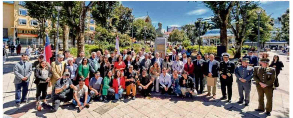
MIGUEL A. BUSTOS A. /UNONOTICIAS.