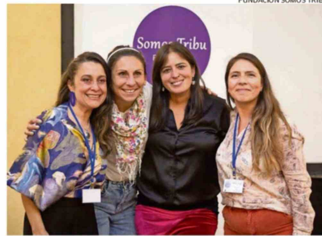
CUATRO PROFESIONALES SON LA BASE DE LA INSTITUCIÓN.

- Había mucha afectación en la dimensión socio afectiva. Había algunas que les costaba mucho expresarse en público y otras que venían de dinámicas de mucha violencia de género en contextos rurales y de la pes-