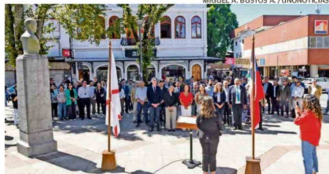
MIGUEL A. BUSTOS A. /UNONOTICIAS.

“ Si el periodismo es un pilar democrático, no basta solo con declararlo. Requiere políticas públicas, marcos normativos y condiciones materiales que permitan a la prensa trabajar con independencia y pluralismo...”