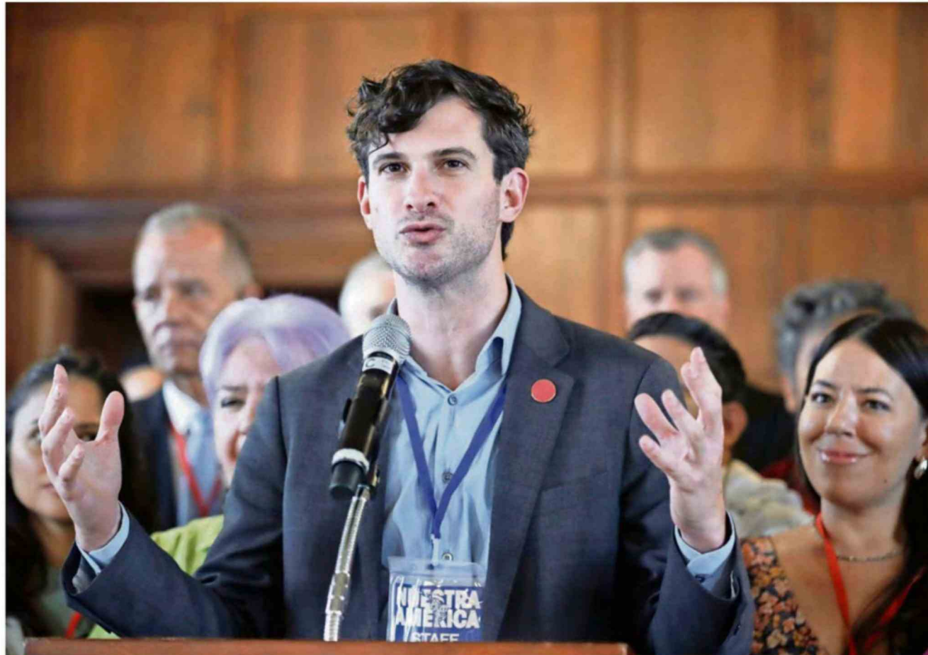
DAVID ADLER ES COORDINADOR GENERAL DE LA INTERNACIONAL PROGRESISTA.

-Esta flotilla es más que una misión: es un movimiento. Nuestro objetivo es usar la movilización marítima para llevar ayu-