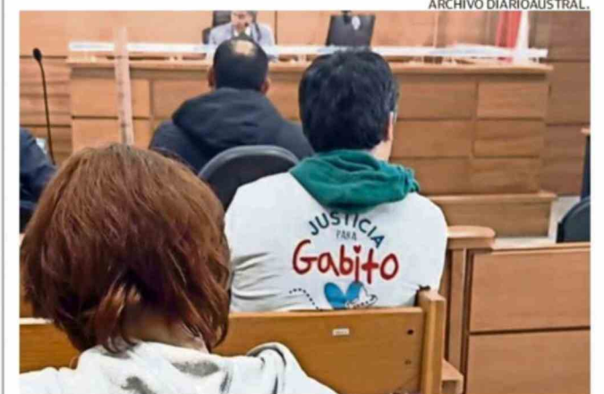
EL TRISTE HECHO OCURRIÓ EN JUNIO DEL 2024 EN EL SECTOR ISLA TEJA.

JUSTICIA. La mujer condenada deberá cumplir once años y medio de cárcel.