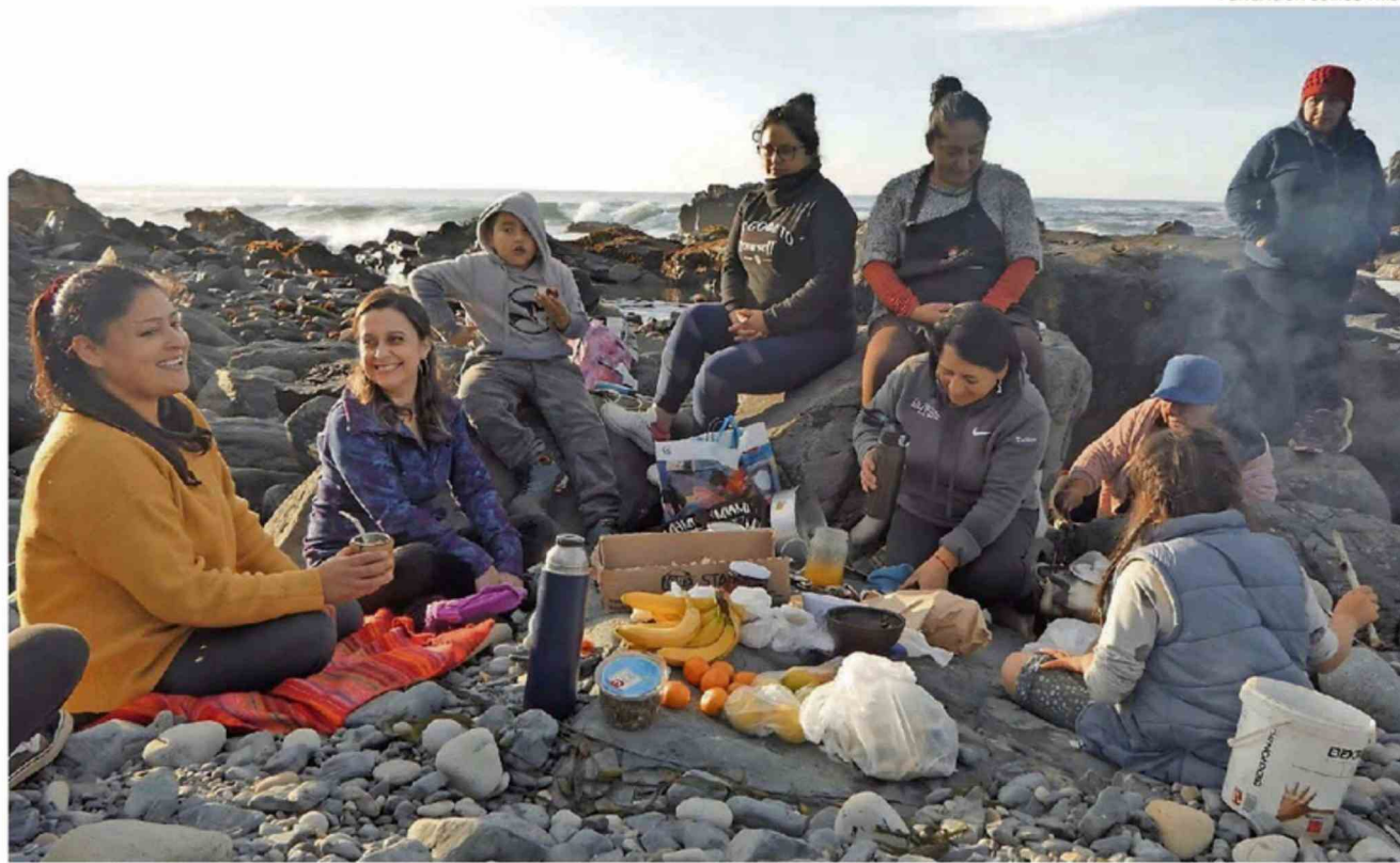
SOMOS TRIBU TRABAJA CON MUJERES DE LA PESCA ARTESANAL Y ACTIVIDADES CONEXAS DE TRES COMUNAS DE LA REGIÓN DE LOS RÍOS.

Somos Tribu funciona desde 2017 con tres grandes líneas de acción: desarrollo rural, mujeres y comunidades; y medio ambiente. En ese contexto y con la fundación instalada en Valdivia es que surgió la posibilidad de realizar un taller de empoderamiento femenino con mujeres de la pesca en Los Molinos. La metodología consideró trabajo corporal, diálogo entre las participantes y un gran círculo de mujeres, todo lo cual fue observado por representantes de diversas insti-