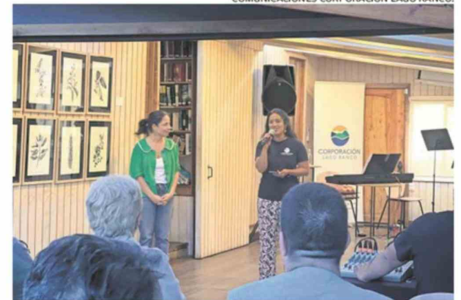
COMUNICACIONES CORPORACIÓN LAGO RANCO.