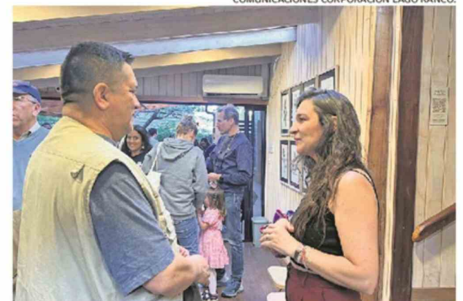
COMUNICACIONES CORPORACIÓN LAGO RANCO.