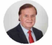
Gastón von Mühlenbrock Zamora Diputado por Los Ríos

Por estos motivos es que se requiere de una nueva regulación que establezca una prohibición efectiva, e imponga obligaciones de control a las plataformas de redes sociales, así como medidas para la protección de datos en cuentas creadas por menores que podrían ser eliminadas en caso de aprobarse esta iniciativa.