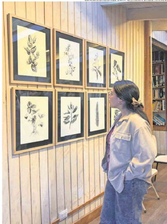
SE PUEDE VISITAR ENTRE LAS 9:30 A 13:30 HORAS Y DE 15:00 A 17:30 HORAS.