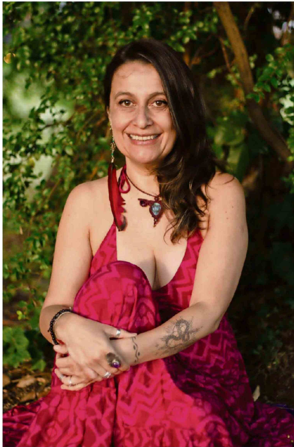
MOMBERG HA ESTADO VINCULADA TODA SU VIDA A LABOR SOCIAL Y A LAS REALIDADES DE ZONAS ALEJADAS.

“Hubo detonantes que son más personales, como el mirar la historia de mi linaje, de mis ancestras y de las ancestras de las mujeres que me rodean. También, el observar las brechas de género y el haber vivido situaciones difíciles y de desigualdad de género por el simple hecho de habitarme como mujer. Todas esas cosas me motivaron a estudiar para luego trabajar para y con las mujeres. Siempre he tenido la mirada puesta desde ese lugar, desde la equidad de género pro-