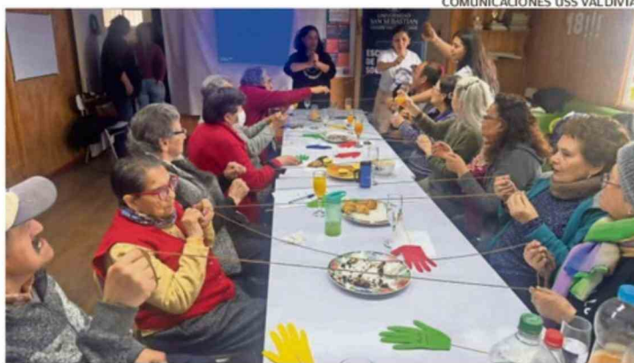
COMUNICACIONES USS VALDIVIA.