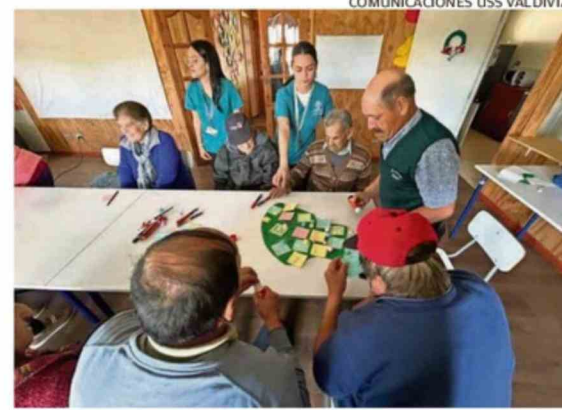
COMUNICACIONES USS VALDIVIA.