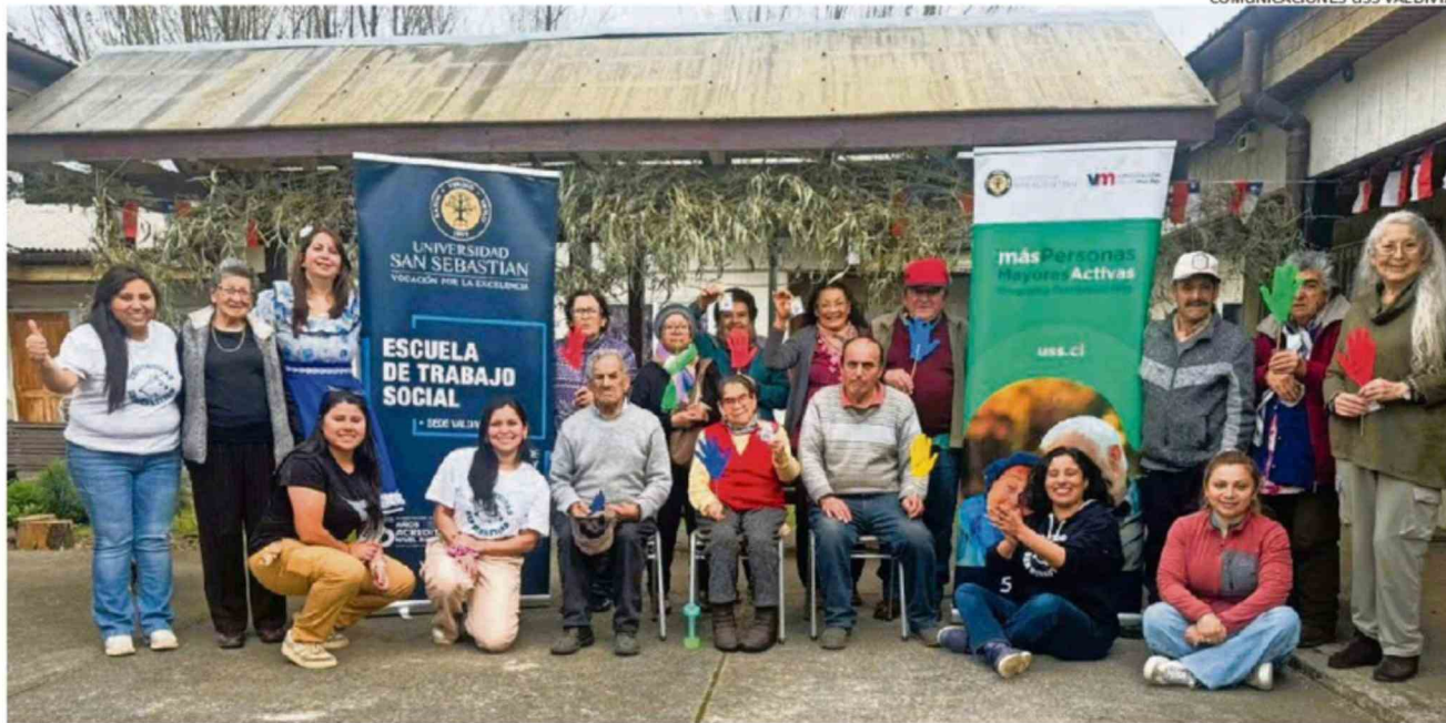
COMUNICACIONES USS VALDIVIA.