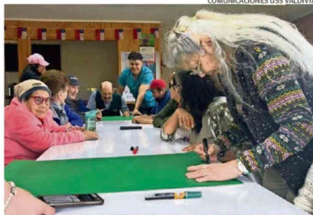
COMUNICACIONES USS VALDIVIA.

das Tuteladas de Río Bueno alberga a 20 personas mayores, de entre 67 y 94 años, muchas de ellas con redes familiares limitadas y en situación de vulnerabilidad socioeconómica. En este contexto, los estudiantes participaron en el levantamiento de información inicial, el diseño de talleres y la ejecución de actividades orientadas a fortalecer la comunicación, la resolución pacífica de conflictos, el acceso a información sobre derechos y la participación comunitaria.